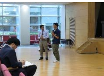
参加学生からのご感想ご意見