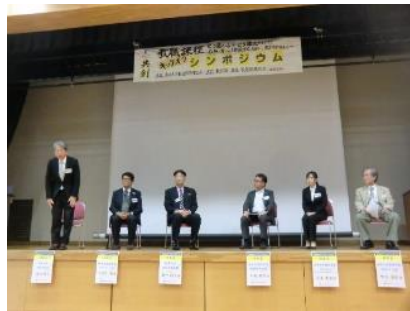
ご登壇のみなさま