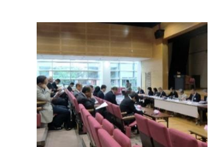
(同日開催「評議員会」の様子)