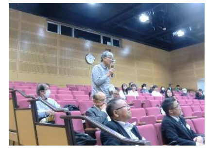
フロアーよりご意見と提言