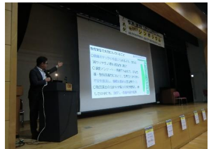
松島孝司附属中学校長より